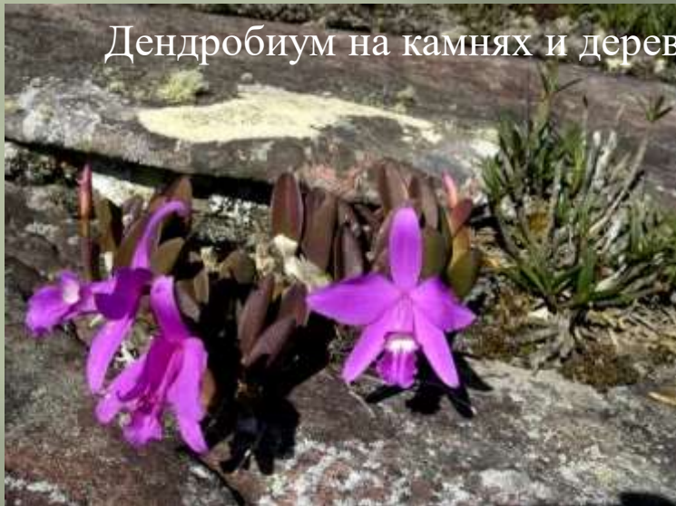
Дендробиум на камнях и деревьях