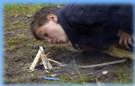
Правильно разжигать костер