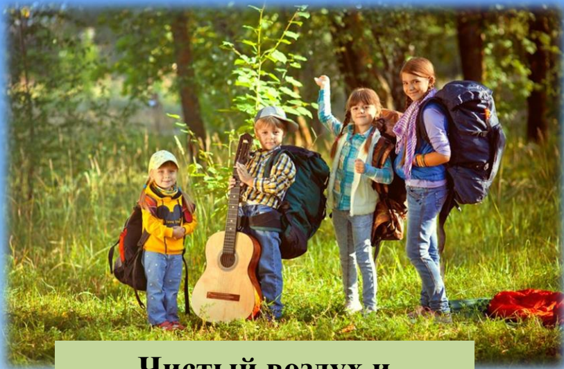
Чистый воздух и прекрасная природа