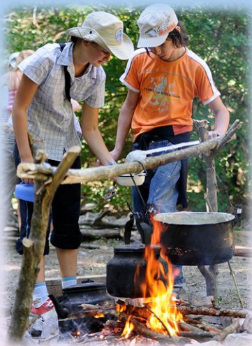
Готовить кушать на костре